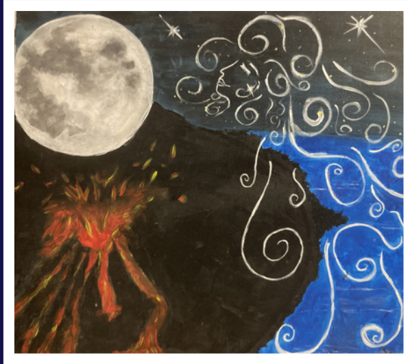
✦ Songe d'une nuit étoilée © Esther Lobet-Bedjedi