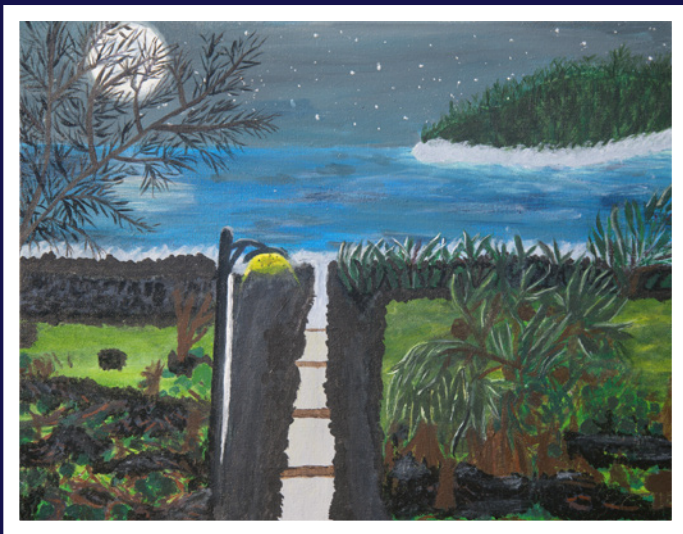
La Line o plin sir débarcadère