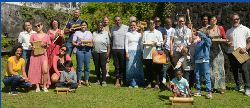
Groupe atelier Fonnkèr

L’aventure ne s’arrête pas là. Les premiers textes bruts repasseront sous la plume de Jean-Yves Hoarau, amoureux de la langue et de la graphie créole.