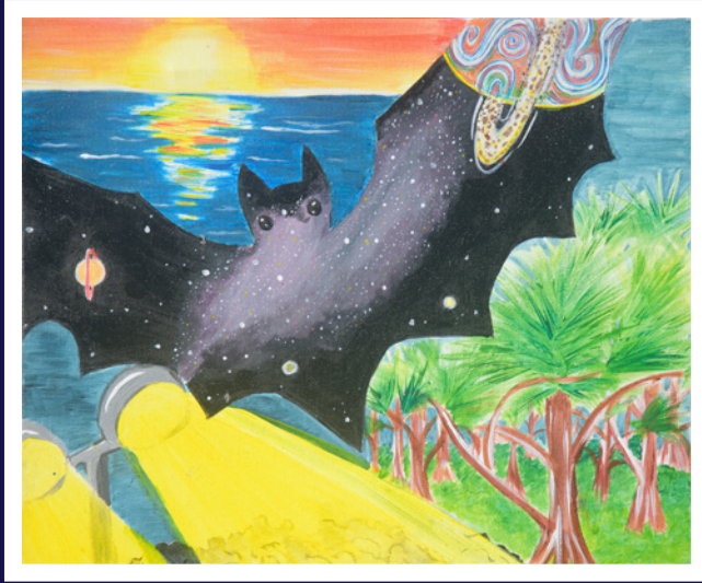
✦ Chauve-souris en nostalgie © Aline Fontaine