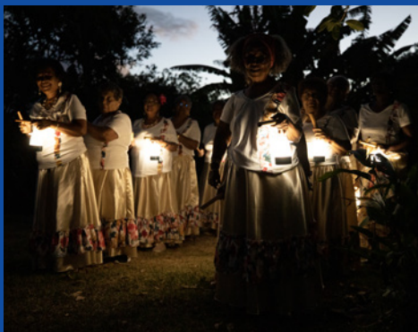
Soirée de restitution artistique du 3 décembre 2022 à St-Philippe

La soirée fut pleine d'échanges et de partages constructifs, de restitutions artistiques, avec un repas et un concert acoustique à la lueur des photophores.