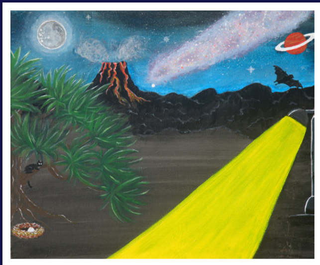
✦ Une imposture dans la nuit